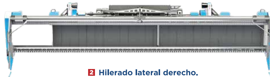
2 Hilerado lateral derecho.