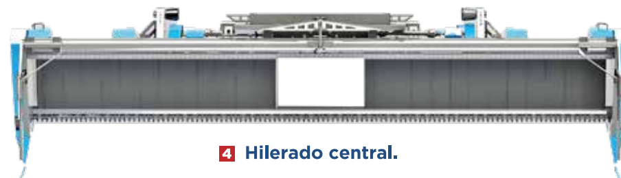
4 Hilerado central.