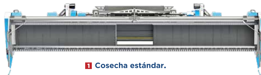
1 Cosecha estándar.