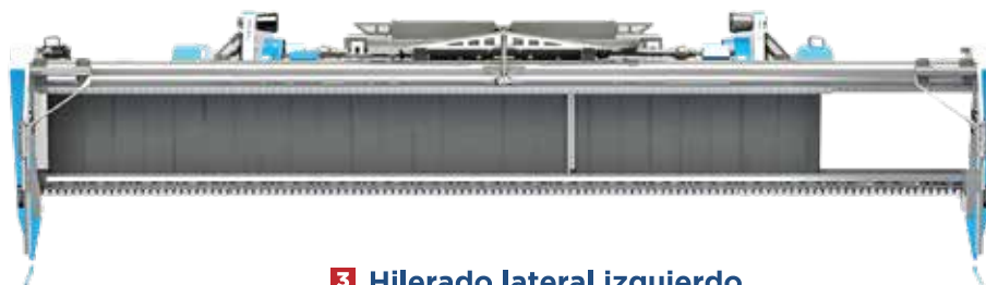
3 Hilerado lateral izquierdo.