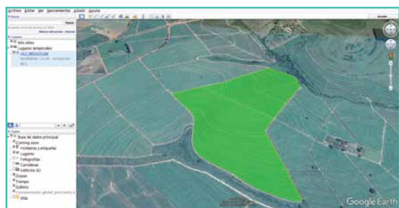
Visualización en Google Earth del plan completo de fertilización

aplicaciones a tasa variable con mapas de prescripción. Genera mapas de registro de actividades donde detalla tiempos de trabajo, parada, traslado, velocidad, dosis aplicada y otros para su posterior análisis.