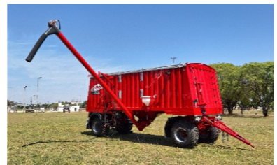
Sistema de descarga. (adaptable a sembradoras Air drill)