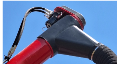
Boquilla de descarga giratoria.