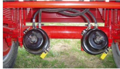
Opcional: eje con frenos de 8".