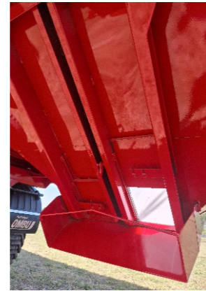
Bandeja de descarga.