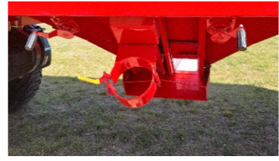
Nuevo sistema de apertura boquilla, con piñón y cremallera.