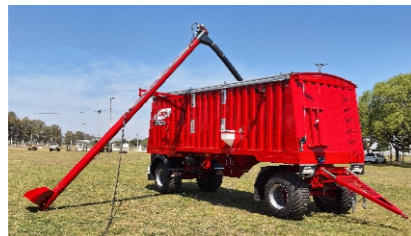
Sistema de autocarga.