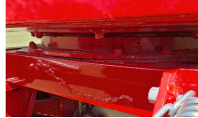
Aro giratorio del tren delantero.