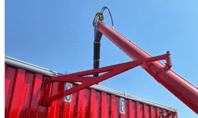
Nuevo sistema de bandera.