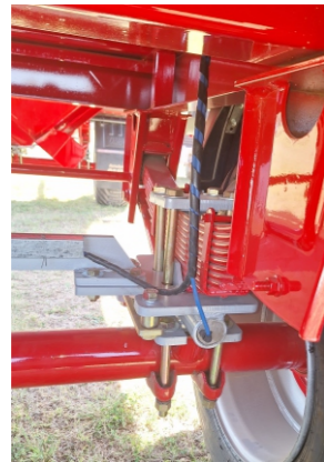
Eje delantero y suspensión. Opcional: Balanza.