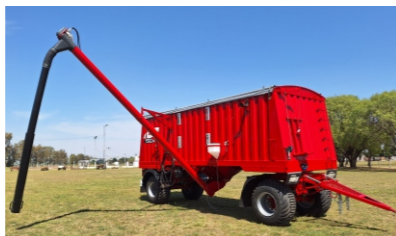
Descarga a sinfín.