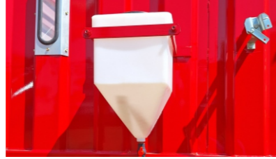
Depósito para inoculante.