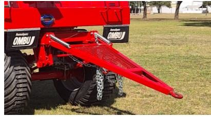
Lanza y tren delantero.